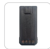
Batería de Li-Ion 1500 mAh