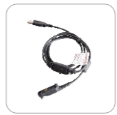
Cable de programación PC155