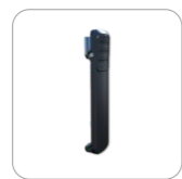
Clip para el cinturón