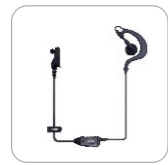
Auriculares tipo C