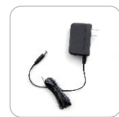
Adaptador de energía 12 V/1 A