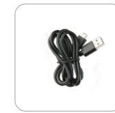
Cable de datos