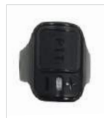
PTT inalámbrico de dedo