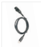
Cable de programación (USB)